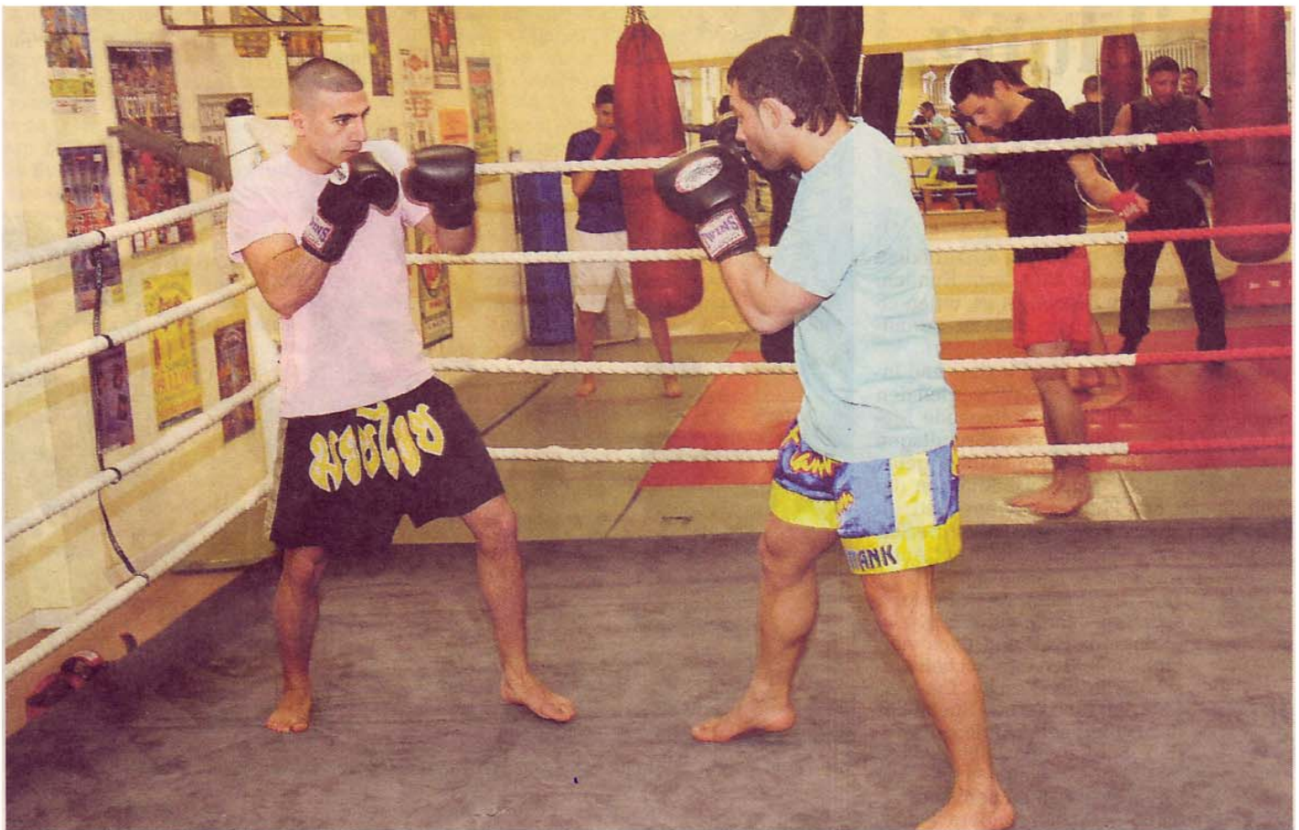
Im Flamingo Gym trainieren Jugendliche unterschiedlicher Nationen. Das Studio ist für viele von ihnen eine zweite Heimat.